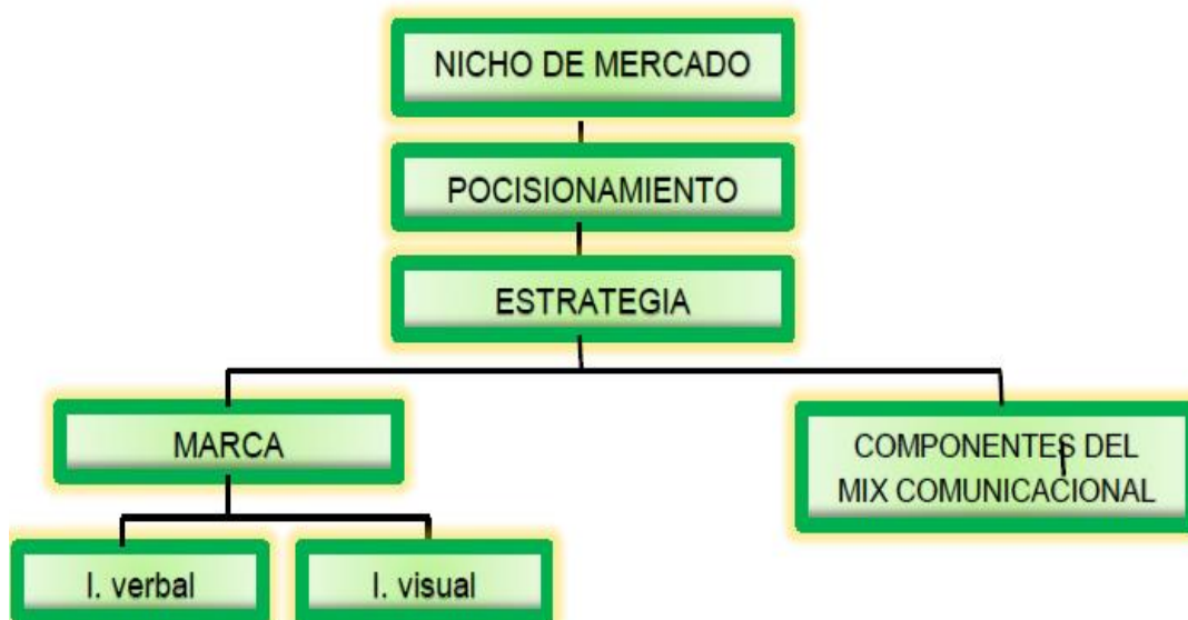
Figura 1. Esquema general de la propuesta

Después de haber realizado un análisis de la situación actual del gabinete, con respecto a la falta de posicionamiento de la marca, se realizó una propuesta de estrategia comunicacional para el gabinete “FisioSalud”, con el fin de hacer conocer al nicho de mercado sobre los diferentes servicios que ofrece a través de los diferentes medios de comunicación, llegando a captar más clientes y de esta manera aportar al posicionamiento de la marca.