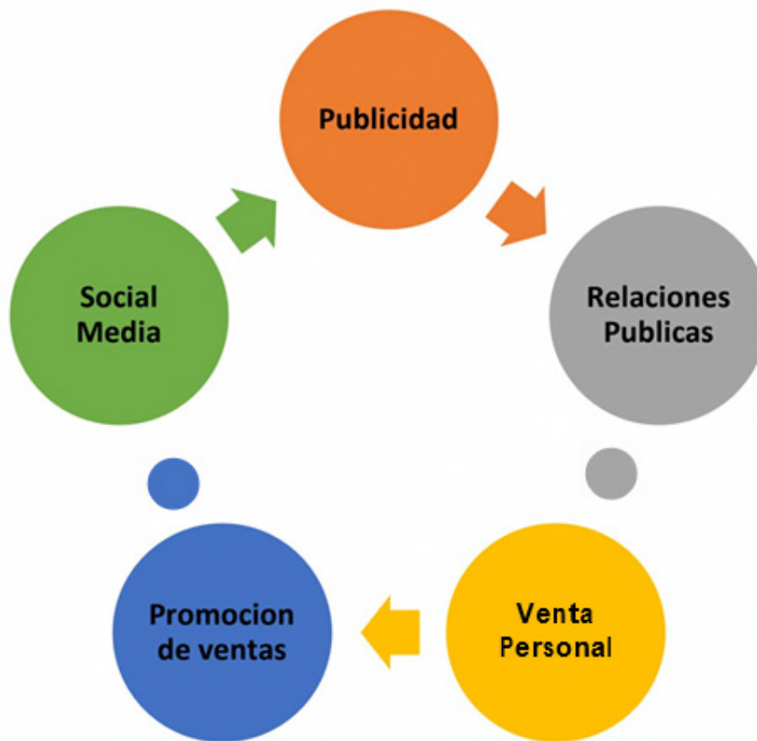
Figura 3. Elementos de la mezcla promocional. Basado en a Lamb, Hair Mac y Daniel C. (2018).

Marketing con aplicaciones para América Latina. Nota: la figura muestra los elementos que deben ser considerados para la propuesta de estrategias para la promoción de lanzamiento de productos.