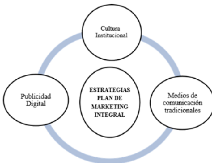
Figura 3. Estrategias del Plan de Marketing Integral