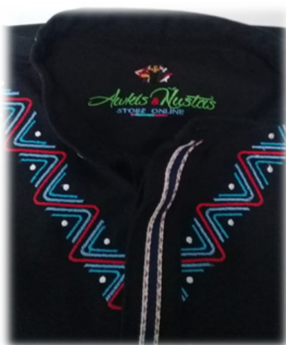
Figura 10. Camisa Diseñada.