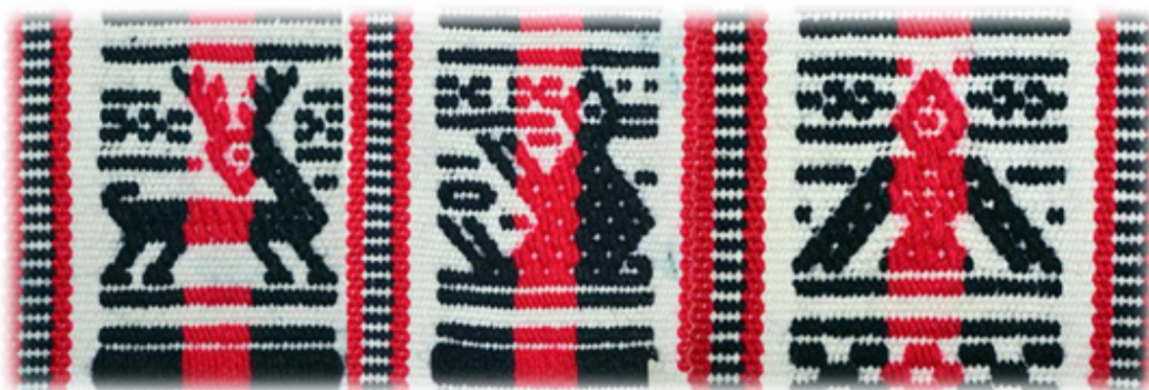
Figura 7. Chumbi Diseñado.