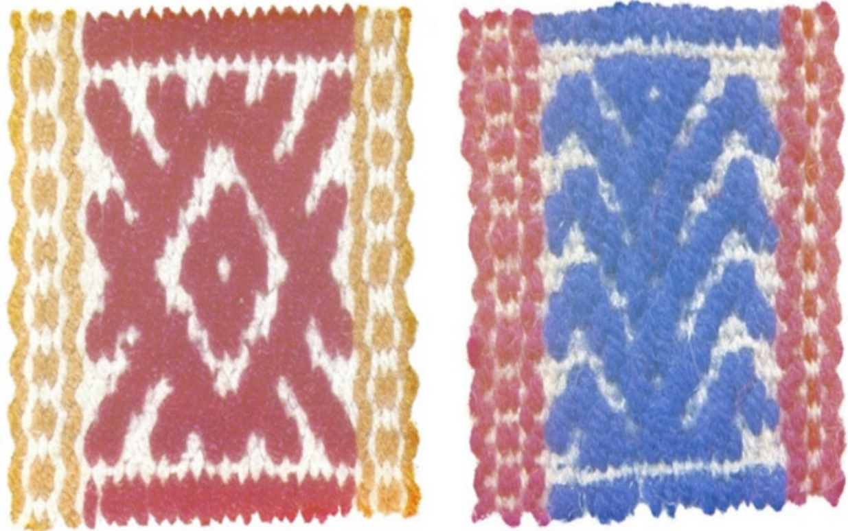
Figura 4. Iconografía Guaconas–Opotes.

prendas y utensilios se puede observar los símbolos, los iconos y gráficos que representa a los códigos culturales de dualidad, tripartición y cuatripartición. A continuación, los iconos y gráficos recopilados en la investigación: