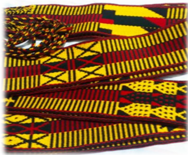
Figura 6. Chumbi Kawina.