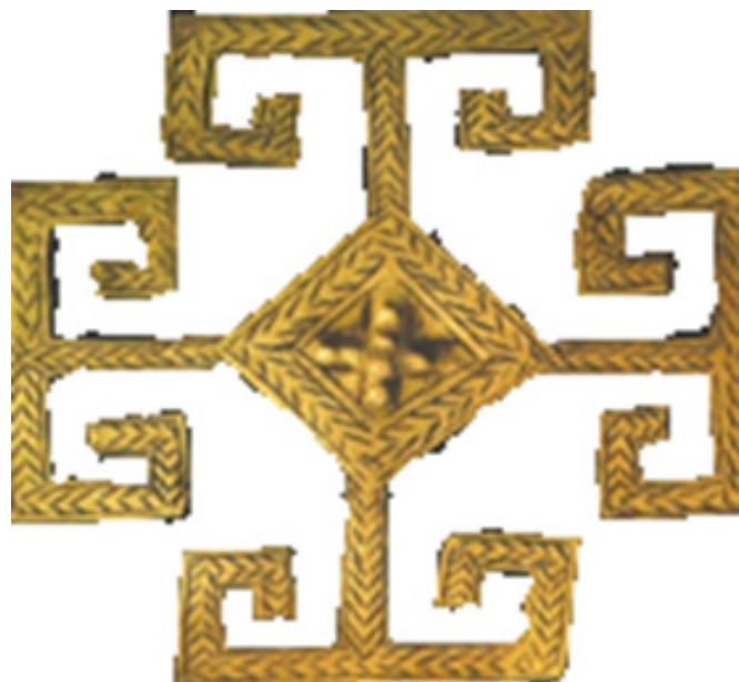
Figura 2. Coral Puruhua precolombino.

La dualidad para el mundo indígena es un principio inherente a la cosmovisión de los pueblos andinos, a la dualidad el diario Telégrafo (2021) lo define como: