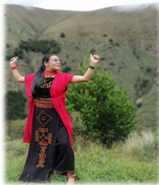
Figura 13. Indumentaria Puruhua Diseñada.

Al diseñar la primera blusa negra con símbolos Puruaes propios, al usar por primera vez le causa desestimación en la juventud indígena, al subir al bus con esa vestimenta en los años 2001 le preguntan y confunden con la ubicación y pertinencia del pueblo, a pesar de esa dificultad sigue con su trabajo de investigación y de diseño de símbolos.