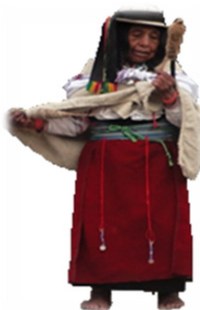
Figura 1. Indumentaria Guaconas-Sicalpa. Elaborado por: Bacilio Pomaina Pilamunga.