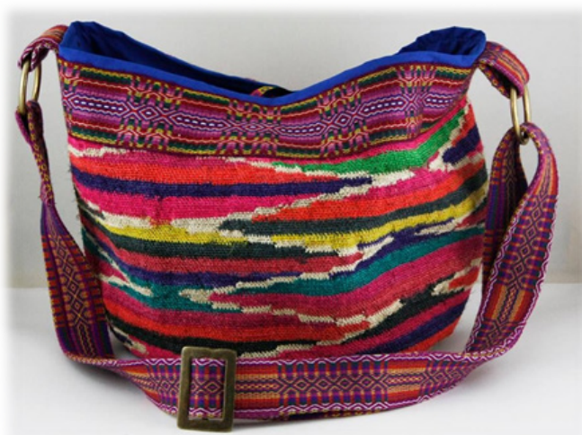
Figura 11. Shigra Diseñada.