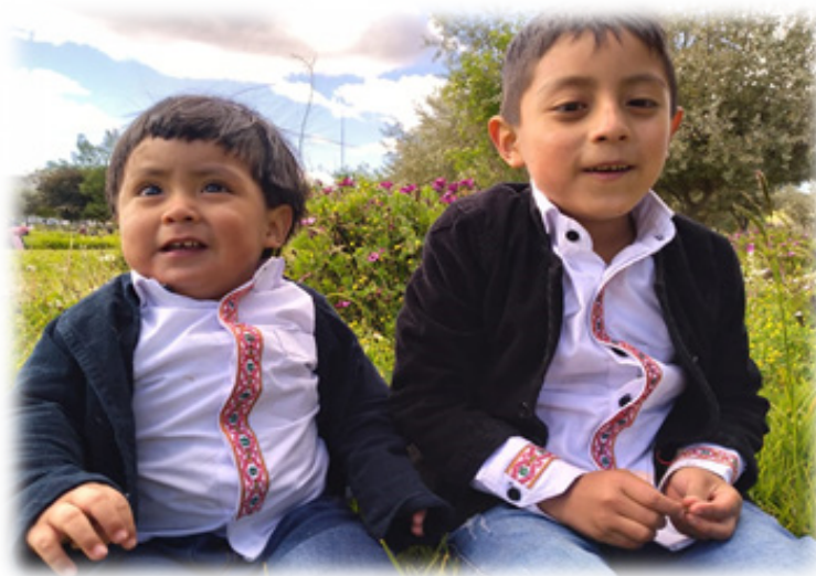
Figura 15. Indumentaria Puruhua.