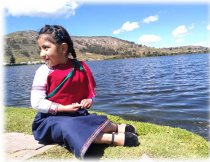
Figura 14. Indumentaria Puruhua.

sido protagonista en algunas publicaciones, más allá de su afición o afinidad con tan corta edad afirma su identidad y pone en vigencia el simbolismo y la práctica de los códigos culturales.