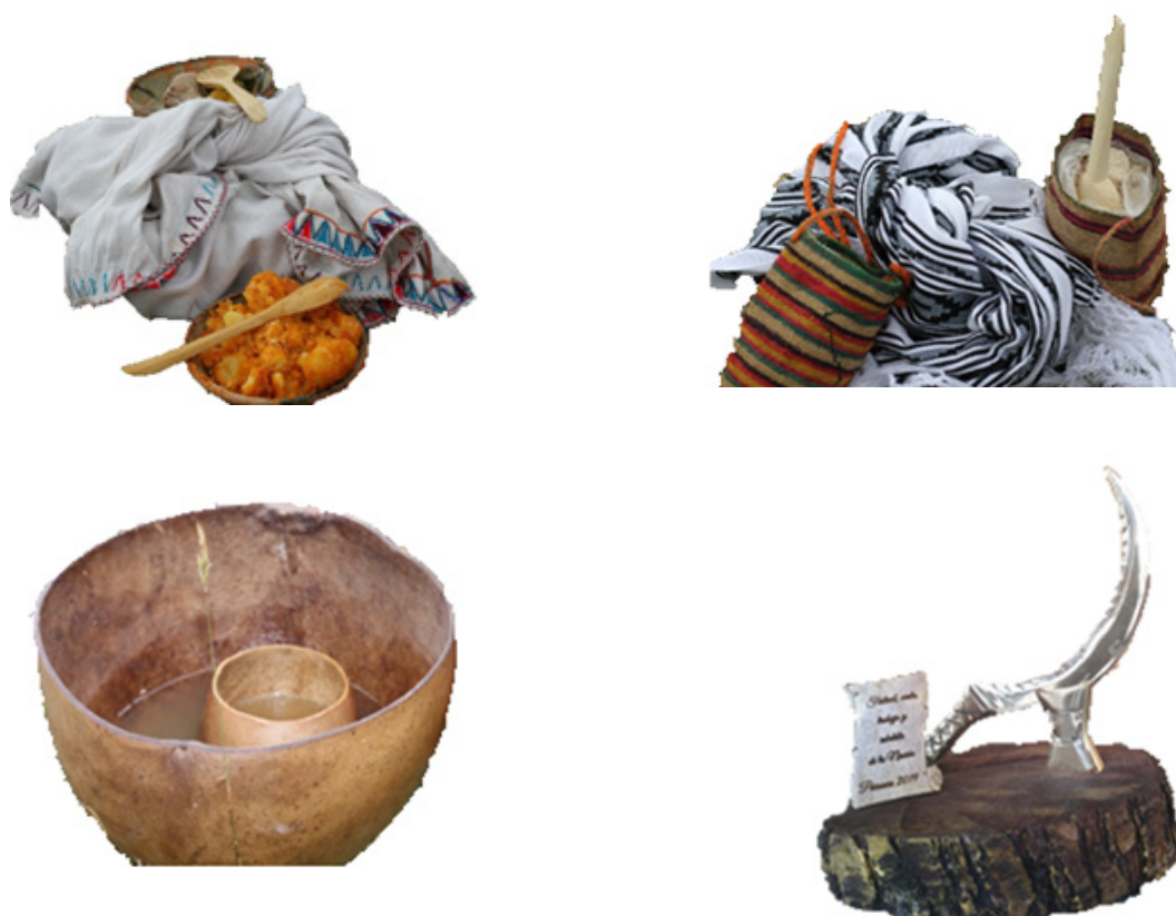
Figura 12. Galería de Utensilios.

A pesar de estas secuelas, en las comunidades indígenas de la provincia de Chimborazo mantienen, reinventan y usan, los siguientes utensilios en el uso cotidiano y familiar: shigra, kipi, platos, wingo, decorativos y etc.