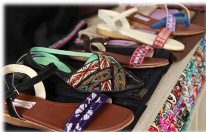
Figura 9. Sandalias Diseñadas.