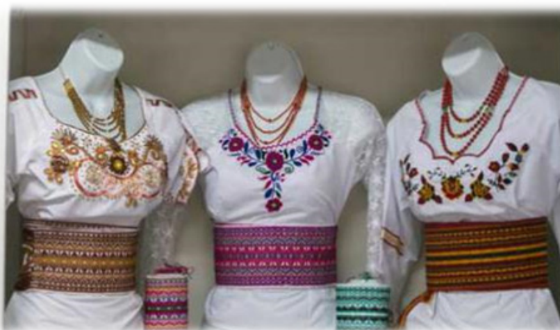
Figura 8. Blusas Bordada.